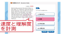
速度と理解度を計測

長文を読んで問題に答えることで、読書速度と読解速度を算出。問題は日本語のみから英問英答に徐々に難易度アップ。