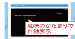
意味のかたまりで自動表示

読書速度に合わせた読むトレーニング。意味のかたまりごとに表示されたスラッシュリーディングで、前から読み進める習慣をつけます。