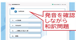
発音を確認しながら和訳問題

1回の長文問題で使用する約20~50語の語彙を出題。ネイティブ音声でも確認できます。